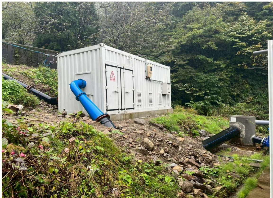
発電設備 発電に使用した水は全量河川に戻しますが、 河川と用水に分けて戻すことも可能